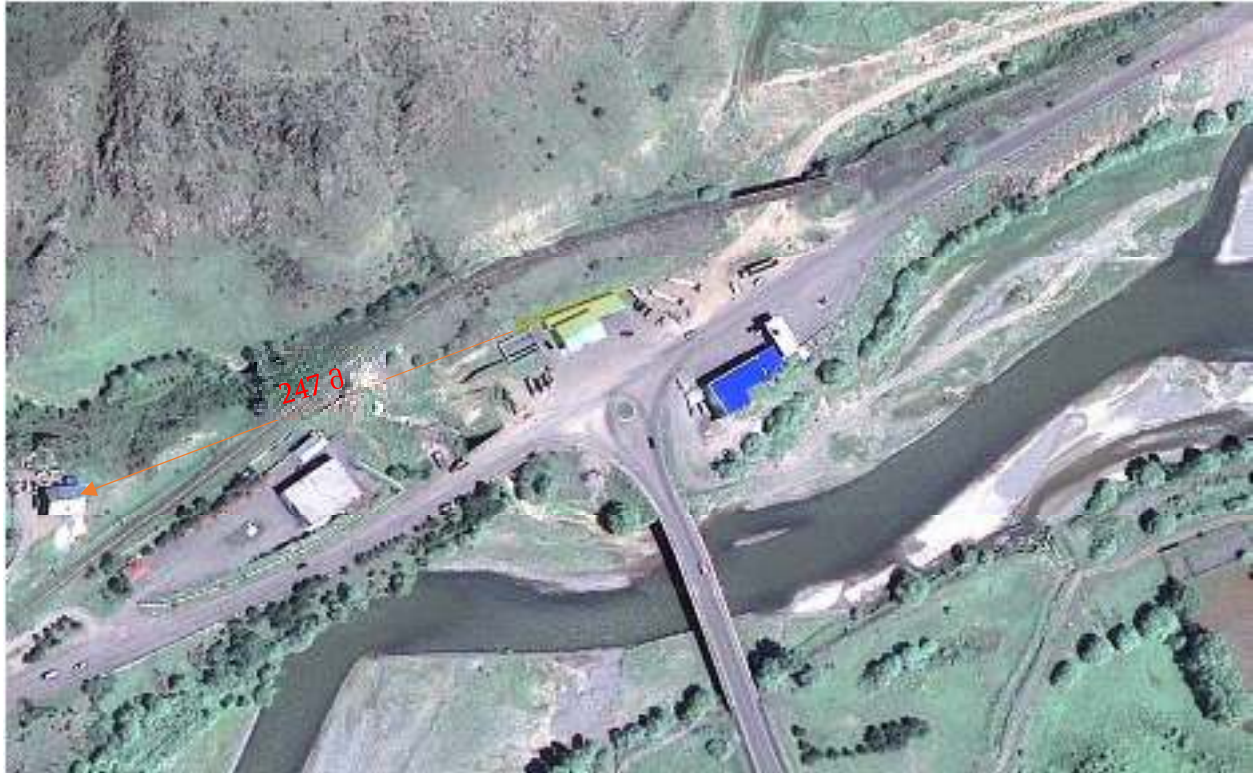
ილუსტრაცია 1 საპროექტო ტერიტორიის სიტუაციური რუკა